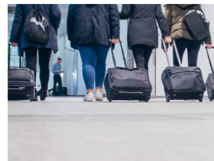
Moderne Infrastruktur als Grundlage für den Weg in die Zukunft.