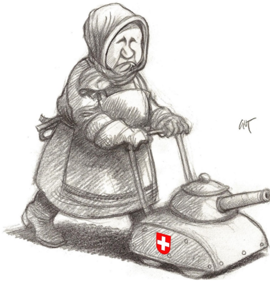
GRAFIK: «Neue Zürcher Zeitung» Nr. 11, 14./15. Januar 2023, S. 21 | bearbeitet